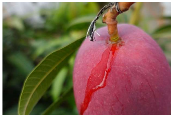
完熟マンゴー (イメージ)

当日に採れた2種類のマンゴーを空輸し当日中にお渡しするという産直販売は、当ホテルが羽田空港直結、川崎キングスカイフロント東急REIホテルは多摩川を挟んで羽田空港の対岸にあり車で約15分という立地と、株式会社日本産直空輸の協力により可能となりました。各産地2玉ずつのセットの他に宮古島と宮崎のマンゴーが1玉ずつ入った食べくらべセットもご用意いたします。