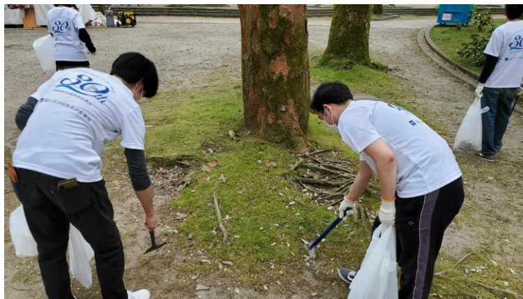
2022 年 4 月実施の様子