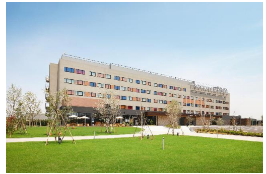
川崎キングスカイフロント東急 REI ホテル

https://www.tokyuhotels.co.jp/kawasaki-r/information/78972/index.html