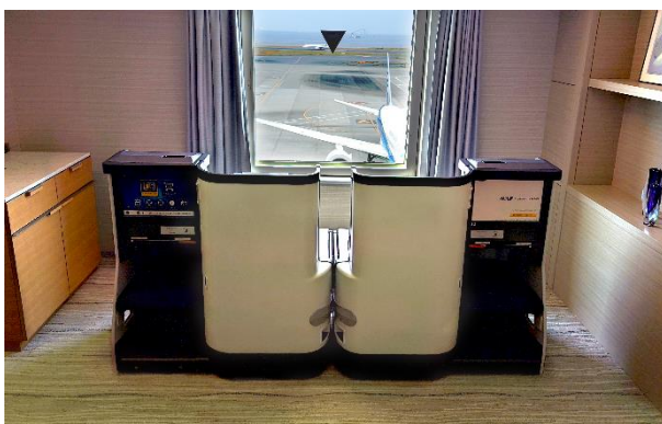
滑走路を正面に臨むビジネスクラスシート

この機会にぜひ、エアポートホテルならではの充実のホテルステイをお楽しみください。