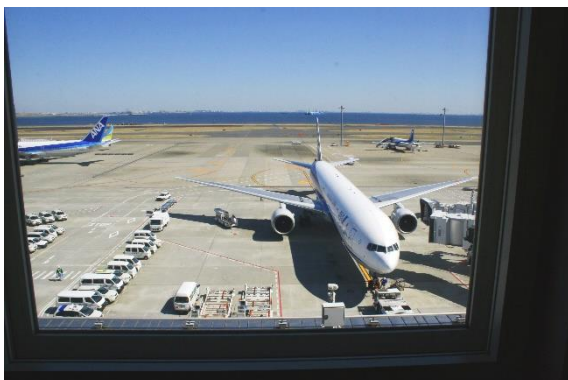
リアル之窗からの風景 (羽田空港C滑走路)

羽田空港C滑走路に面し飛び立つ飛行機やその奥には東京湾を一望できるリアル之窗、世界各地1,200種類以上の風景の中から思い出の場所や行ってみたい都市へ疑似旅行できるスマートウィンドウ。これら二つの窓を持つプレミアフライヤーズルームで、リアルとバーチャルの融合をぜひ体感してみてください。