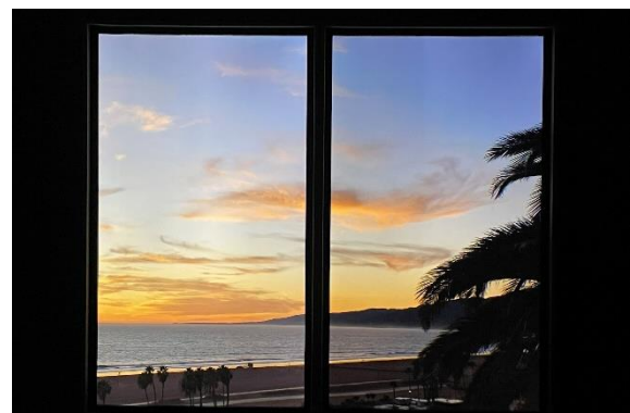
スマートウィンドウからの風景(夕暮れのサンタモニカ)