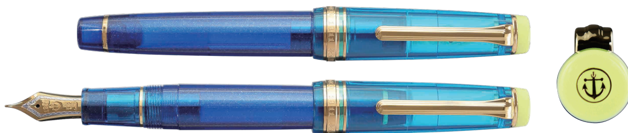
プロフェッショナルギア『クレ・アジュール万年筆』

セーラー万年筆(社長:比佐泰、本社:東京墨田区)は、人気のカクテルシリーズ第10弾となる「プロフェッショナルギア クレ・アジュール万年筆」を2020年9月27日(日)より限定1,800本、カクテルシリーズ万年筆発売10周年を記念した特別限定企画「カクテルシリーズ万年筆10周年記念セット」を10月25日(日)より発売いたします。