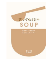
おつかれさまの SOUP 国産きのこと雑穀米の 具たくさんチャウダー