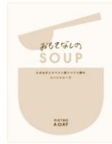
おもてなしの SOUP たまねぎとスペイン産イペリコ豚の コンソメスープ