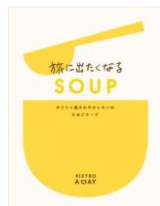
旅に出なくなる SOUP ギリシャ風さわやかレモンの たまごスープ