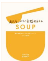
あたらしいことを始める日の SOUP 香川産金時にんじんのポタージュ -レモン風味-