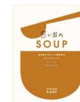
思い出の SOUP 熊本産牛ばら肉と 5種野菜のコンソメスープ