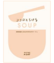
ココロとろける SOUP 淡路島産たまねぎの 甘みポタージュ