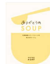
ありがとうの SOUP 北海道産スイートコーンの 甘みポタージュ