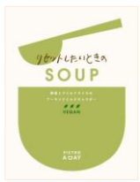
リセットしたいときの SOUP 野菜とワイルドライスの アーモンドミルクチャウダー