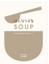
はんなりする SOUP 西京味噌と和素材の 豆乳スープ