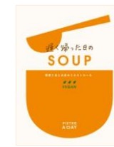
遅く帰った日の SOUP 野菜と豆と大麦の ミネストローネ