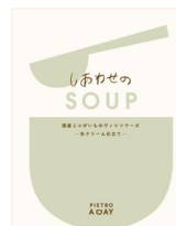
しあわせの SOUP 国産じゃがいものヴィンソワーズ -生クリーム仕立て-