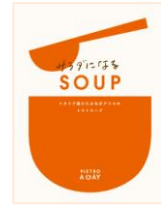
サラダになる SOUP イタリア産小たまねぎグリの トマトスープ