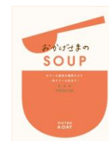
おかげさまの SOUP オマール海老の濃厚ビスク -生クリーム仕立て-