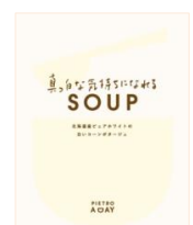
真っ白な気持ちになれる SOUP 北海道産ピュアホワイトの 白いコーンポタージュ