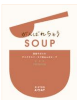
がんばれちゃう SOUP 国産牛ばらをデミグラス ソースで煮込んだスープ