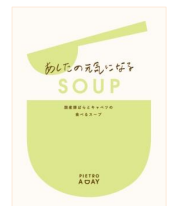
あしたの元気になる SOUP 国産豚ばらとキャベツの 食べるスープ