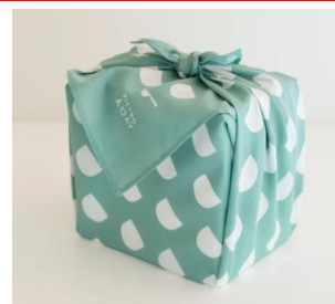
ふろしきイメージ

2,000円以上のお買上げで、オリジナルふろしき(500円相当)もしくは「1日がhappyになる SOUP」(400円相当)をプレゼント。