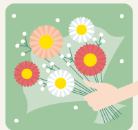
「ありがとう」を伝えたい時に