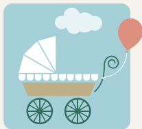
結婚・出産祝やそのお返しに