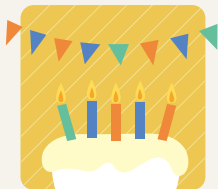
大切な人のお誕生日に

SNS でいつでも贈れるので、お誕生日のサプライズや、ちょっとしたお礼にもぴったりです。メールやチャットのやり取りが多いビジネスシーンの贈り物にも！