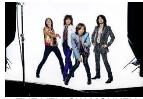
THE YELLOW MONKEY