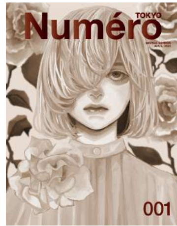
<西 ✕ NISHI>