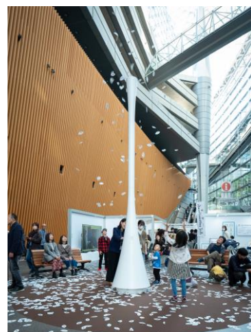
《まばたきの葉》広場

アクセシビリティを支援する最新機器のコーナーは、家族を介護する方、技術に関心を持った若い人たちなどの関心を集め、免許不要で歩道を走れる近距離モビリティの試乗など、様々な方々が実際に機器を使用し、その技術に触れました。