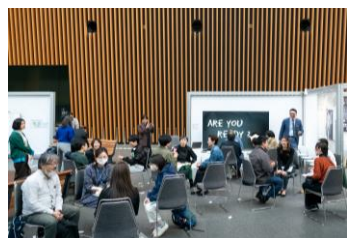
ワークショップ／トーク