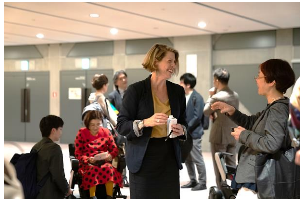
登壇者との交流スペースの様子

東京都と公益財団法人東京都歴史文化財団 アーツカウンシル東京が、10月29日（火）から11月3日（日・祝）まで、東京国際フォーラムで開催した「だれもが文化でつながる国際会議2024」は、芸術文化関係者、福祉・医療関係者、教育関係者、学生、家族連れなど、国内外から延べ約7,000名の方にご参加いただき、6日間の会期を終了しました。