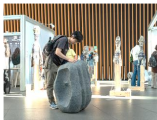
触れる彫刻の鑑賞