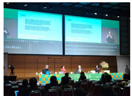
セッションの様子

講演と4つのセッションでは、国内外の登壇者が、文化、居場所、ウェルビーイング、地域、協働、共生といったキーワードを軸に、議論を深めました。8つの分科会では、主に美術館や博物館などの文化施設等におけるアクセシビリティや芸術文化による社会的包摂などの具体的な取組報告が国内外の登壇者から紹介され、知見が共有されました。特に、先進的な取組で知られるアムステルダム国立美術館のアクセシビリティ担当者の報告には、多くの文化施設関係者が集まり、これからのアクセシビリティ向上施策への高い関心が伺われました。