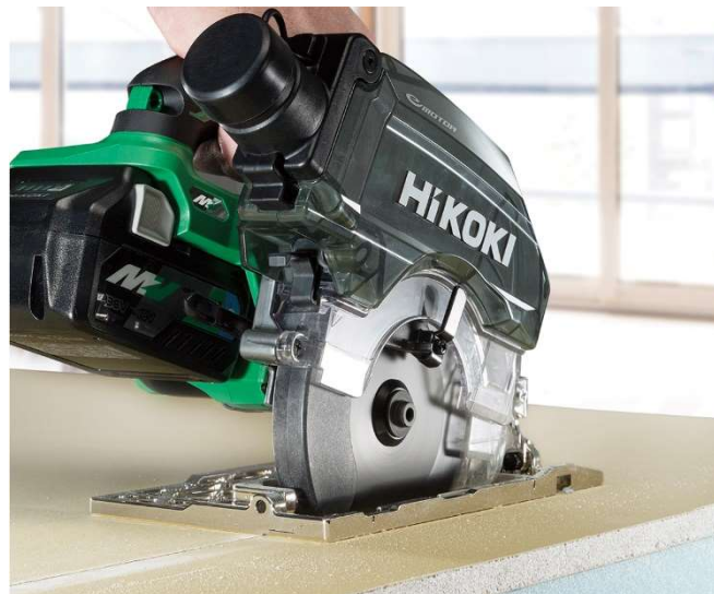
当製品の作業イメージ

フリーダイヤル(無料):0120-20-8822 ナビダイヤル(有料):0570-20-0511