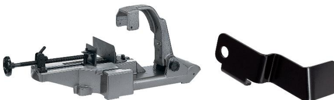
定置式スタンド CB12-ST2 ※5

別売の定置式スタンドを使用することで、定置形で高精度な切断が可能になります。また、コンター(けがき)作業も可能になり、作業用途が拡大します。