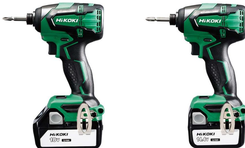
「コードレスインパクトドライバ」(WH18DB形(左)/WH14DB形(右))

工機ホールディングスは、今後とも、使われる方の視点に立った、より良い製品とサービスの開発に努め、お客様であるプロのための「極上」のユーザー体験を提供し、その情熱と信頼に応えてまいります。