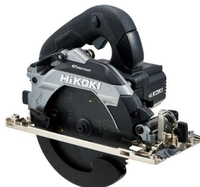
ストロングブラック