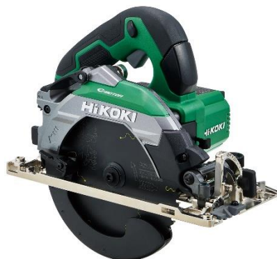
アグレッシュグリーン