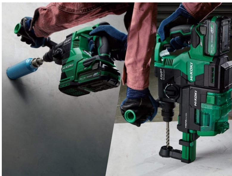
当製品の作業イメージ

フリーダイヤル(無料):0120-20-8822 市外局番(有料):03-5539-0253