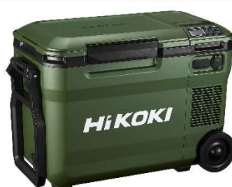
フォレストグリーン