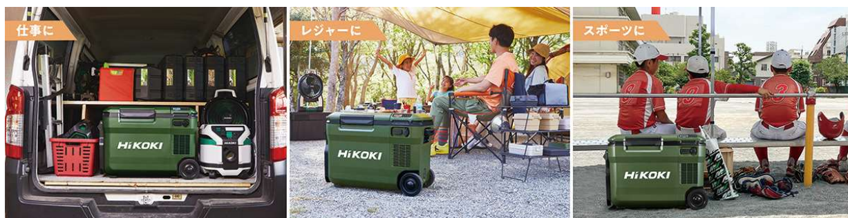
当製品の使用イメージ

工機ホールディングスジャパンはこれからも、販売パートナーのみなさまとともに、お客さま視点に立ったより良い製品の開発とサービスの向上に努め、販売パートナーのみなさまおよびお客さまへの信頼に応えていきます。