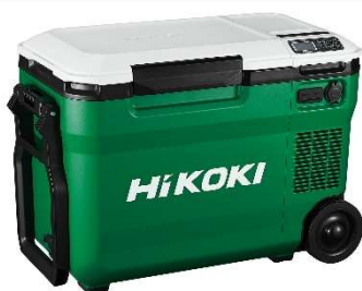
アグレッシブグリーン