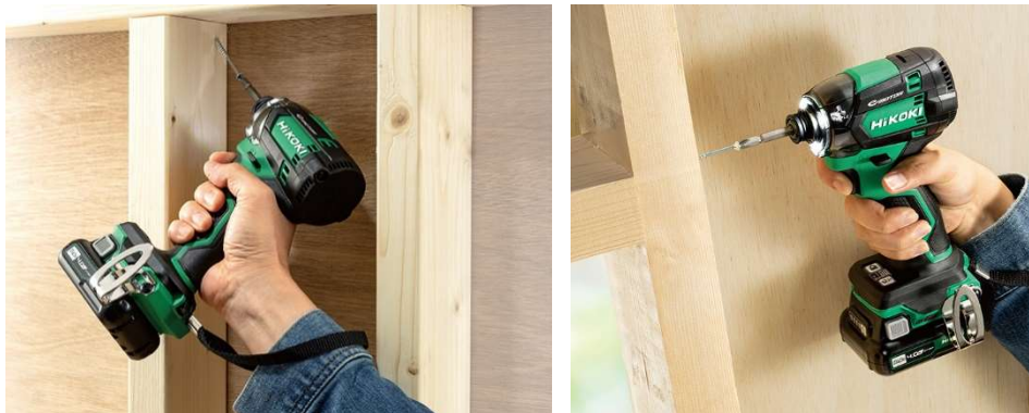
当製品の作業イメージ

工機ホールディングスは、今後とも、お客さま視点に立ったより良い製品とサービスの開発に努め、お客さまであるプロのための「極上」の製品体験を創出し、その情熱と信頼に応えていきます。