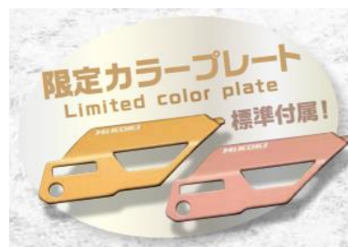
限定カラープレート※