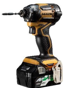
グランドキャメル