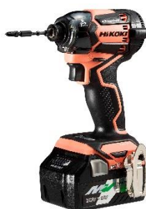
コーラルストーン