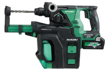
コードレスロータリハンマドリル DH 36DPB

高効率なブラシレスモーターと高出力な蓄電池により、AC100V 並みの穿孔(穴あけ)速度を実現します。