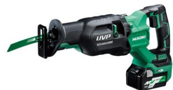
コードレスセーバソー CR 36DA

当社独自のツイン回転式カウンタウエイトによる低振動化とオービタル機構により、作業時間の短縮と振動を低減したより快適な作業を実現します。