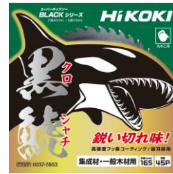
スーパーチップソー黒鯨

従来の 18V 製品と比較し約 2 倍の切断スピードと粘り強さで仕事がかどります。