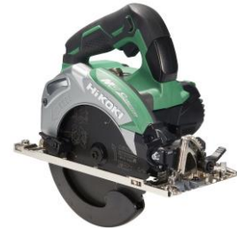
コードレス丸のこ C 3606DA