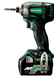
コードレスインパクトドライバ WH 36DA

高速のねじ締めスピードで電池容量が減ってもスピードが落ちにくく、より効率的に作業ができます。