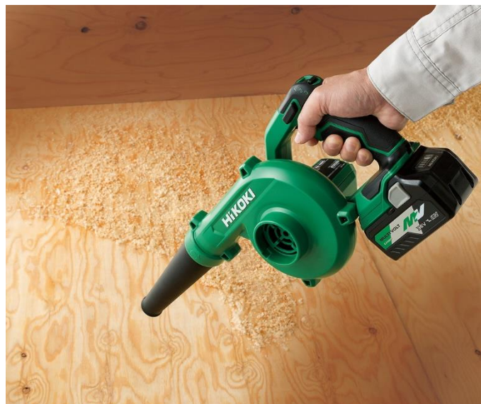
当製品の作業イメージ

フリーダイヤル(無料):0120-20-8822 ナビダイヤル(有料):0570-20-0511