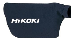
ダストパック(別売り)