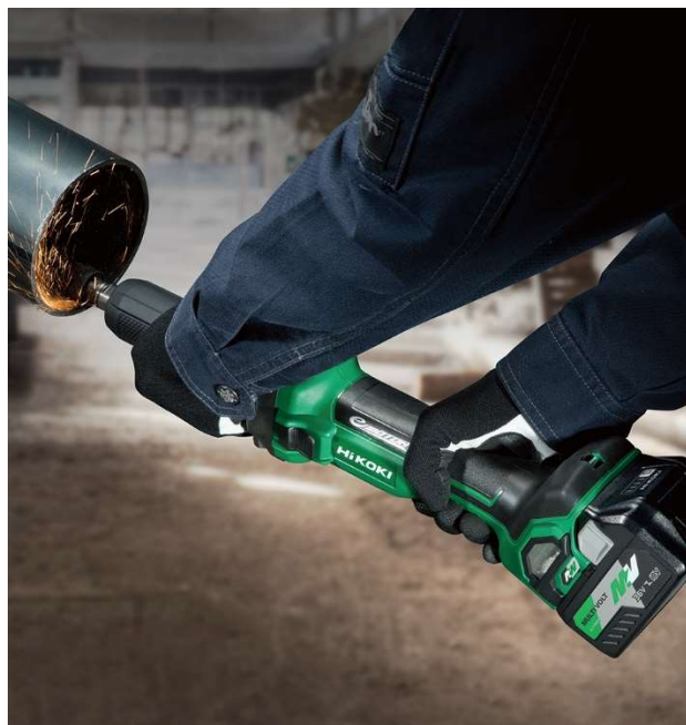
当製品の作業イメージ

フリーダイヤル(無料):0120-20-8822 ナビダイヤル(有料):0570-20-0511