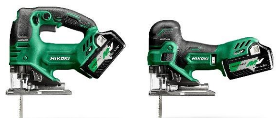
CJ 36DA/CJ 36DB