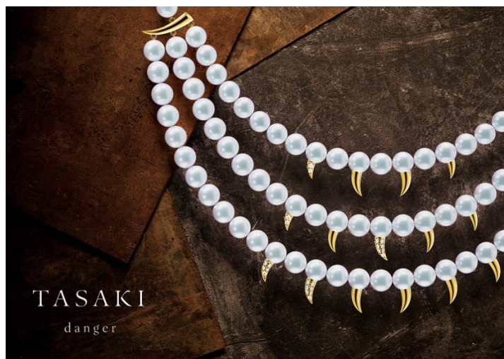
「TASAKI “danger”」 キービジュアル

TASAKI は、ブランドのアイコンジュエリーのひとつである「danger（デインジャー）」の新作発売を記念して、シリーズの世界観を表現するイベント「TASAKI “danger” POP UP Store（TASAKI デインジャー ポップアップ ストア）」を8月23日（水）から29日（火）まで岩田屋本店本館1階 KIRAMEKI BOARD にて開催します。