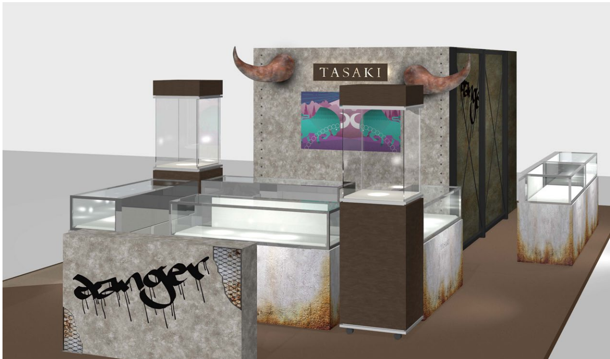
「TASAKI “danger” POP UP Store」 岩田屋本店・会場イメージ ©TASAKI