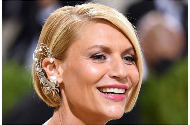
「MET Gala 2021」でのダイアン・クルーガーとクレア・デインズ