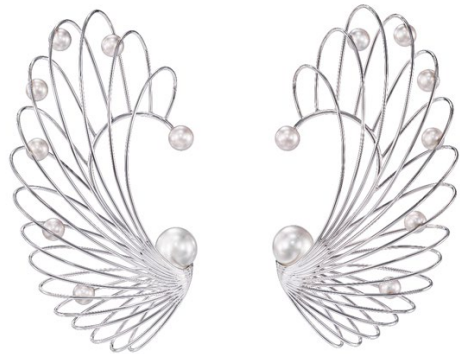
「ナクレアス(Nacreous)」イヤークフ