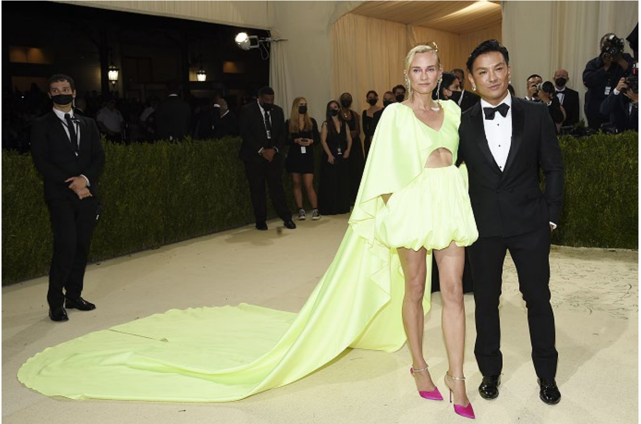
「MET Gala 2021」でのダイアン・クルーガーと TASAKI クリエイティブディレクター、プラバル・グルン