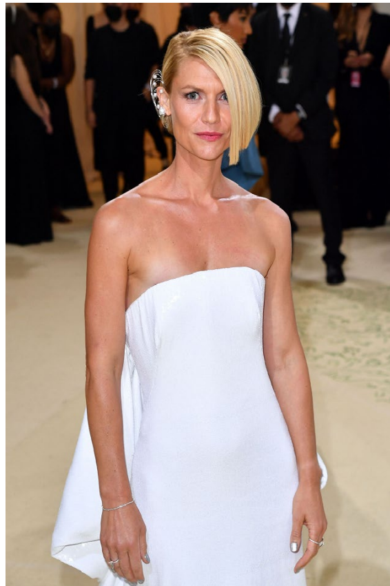
「MET Gala 2021」でのダイアン・クルーガーとクレア・デインズ