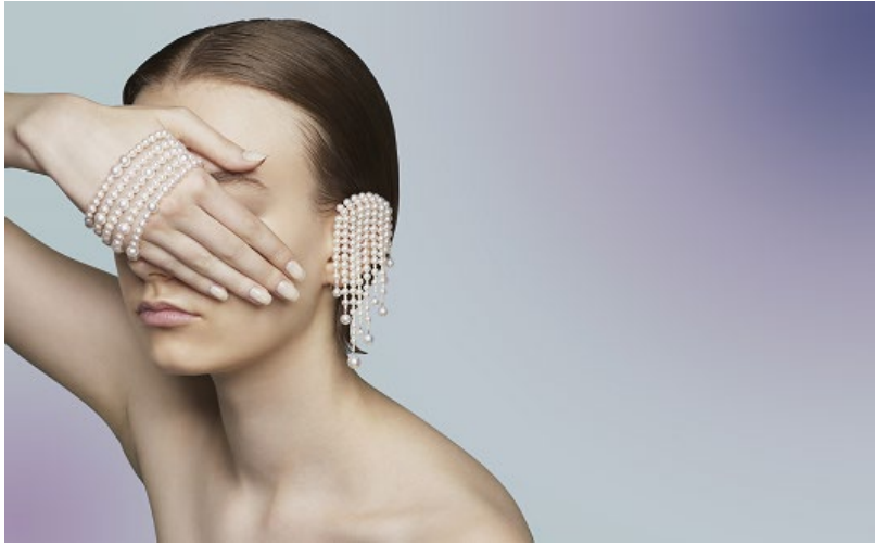
「Nacreous (ナクレアス)」シリーズ