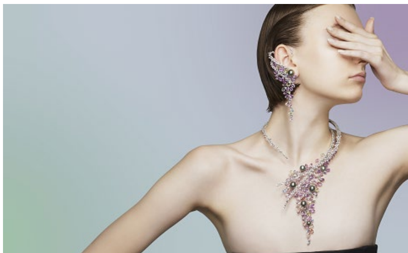
「Illimitable（イリミタブル）」シリーズ

色彩豊かなハイジュエリーのラインナップには、神秘的な煌めきを放つタンブル状のフォルムの他、クッションシェイプやペアシェイプなど様々なファンシーシェイプカットのサファイアを基調に、色鮮やかな珊瑚に魚が棲み、海中を優雅に泳ぐシーンを描いた「Illimitable（イリミタブル）」と、幾重にも降り注ぐ柔らかな光によってオーロラのように様々な表情をみせる海を、パールとダイヤモンド、サファイアで表現した「Aurora（オーロラ）」。