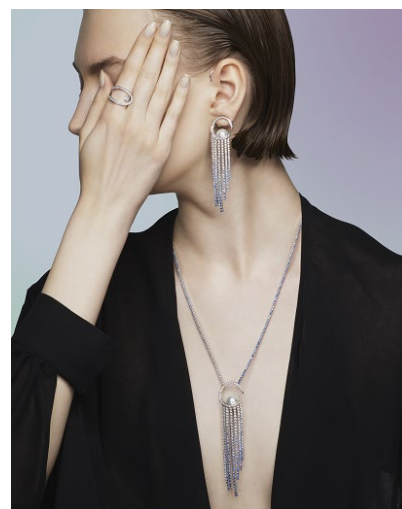
「Aurora（オーロラ）」シリーズ

また虹色の輝きを放つ真珠層のまばゆい重なりを表現した「Nacreous（ナクreas）」の、パールの連なりが耳を優しく覆うイヤークラフと、真珠層が手の上に広がっていくかのようなハンドクラフが登場。高いところからダイナミックに流れ落ちる滝の流れにインスパイアされた「Waterfall（ウォーターフォール）」では、パーツを付け替えることで多彩なアレンジが可能なトランスフォームデザインのネックレスやイヤリングなど、ハイジュエリーにさらなる革新をもたらすデザインがラインナップに加わります。