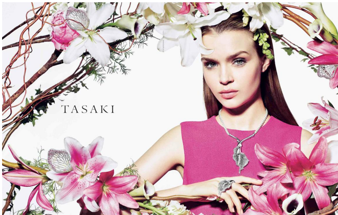
Calla Lily / necklace : PID 15642 ¥9,450,000、ring : RD P2170 ¥6,300,000 Petals / pendant : PIS 15652 ¥525,000(参考)