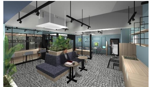
コワーキングスペース イメージ