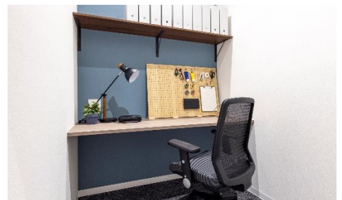
1 名用レンタルオフィス イメージ