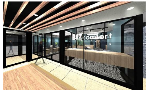
エントランス イメージ