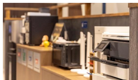
プリンター・ドリンクコーナー イメージ

高速 Wi-Fi、無料プリンター、シュレッダーなど、ビジネスに欠かせない OA 機器の他、フリードリンクも用意しています。また、当施設では、おしゃれなカフェが立ち並ぶ北浜エリアにちなんで上質なスペシャルティコーヒーマシン（有料）も導入し、カフェのような本格派コーヒーを味わうことができます。