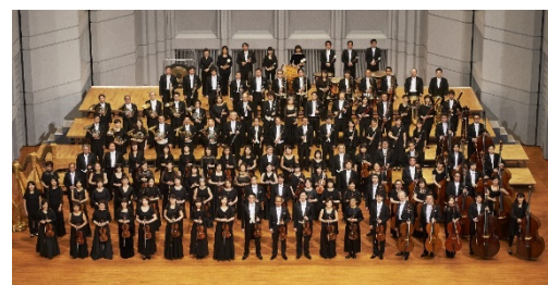
▲管弦楽：東京フィルハーモニー交響楽団

指揮には、イタリアの若き天才ダニエーレ・ルスティオーニを迎え、東京二期会が誇る歌手たちとともにシーズンクローズに相応しい「レクイエム」を奏でます。