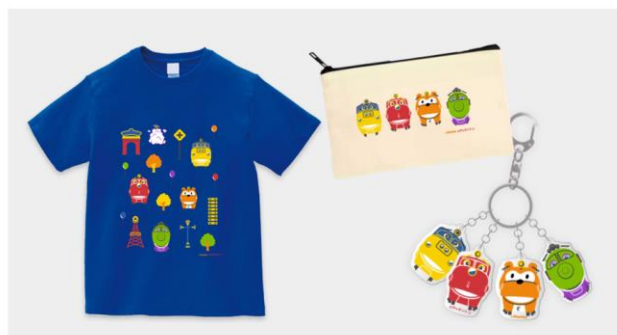
チャギントン コラボアイテムイメージ