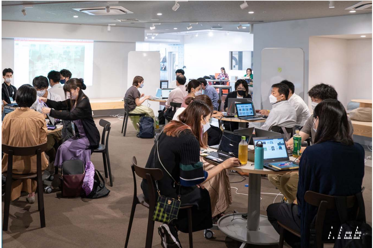
過去の i.lab 主催イベントにおける創造的なワークショップの様子