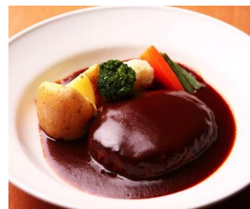
ハンバーグシチュー レギュラーセット 1,480円 (税抜)