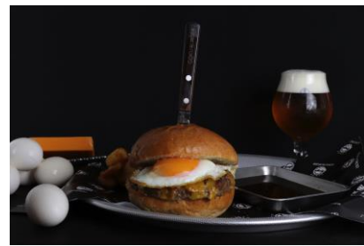
エッグチーズバーガー1,450円 (税抜)