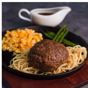
プレミアム ハンバーグステーキ レギュラーセット1,380円 (税抜)