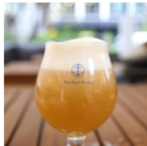
スペシャリティヴァイツェン680円 (税抜)