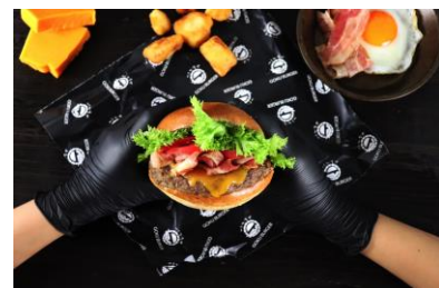
ブラック手袋で豪快にかぶりつけるようになった『GOKU BURGER』

食べるときには、ソースなどが付くの気にせず肉に集中して楽しめるよう、手袋をつけて豪快にかぶりつく“ワンパクスタイル”でお召し上がりください。（テイクアウトも可）(※)ファーストフード店が平均40g程度