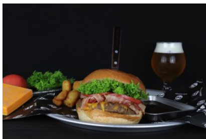
BLTチーズバーガー1,580円 (税抜)

*全てのバーガーは①オリジナル ②てりやき ③シェフズスペシャルの3種類から、お好きなソースをお選びいただけます。