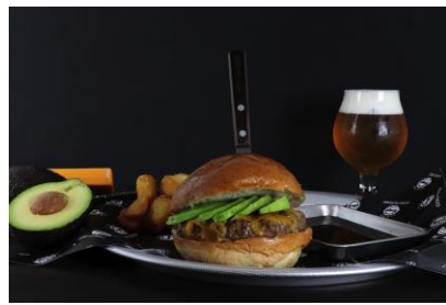
アボカドチーズバーガー1,450円 (税抜)