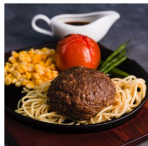
トッピング ジューストマト 300円 (税抜)