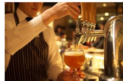
ジャパン・グレートビア・アワーズ2019 金賞を受賞したクラフトビールを用意

ドリンクのラインナップには、オリジナルのクラフトビールブランド『Anchor Point Beer(アンカーポイントビール)』の中から、クラフトビール(地ビール)の品評会「ジャパン・グレートビア・アワーズ2019」(クラフトビア・アソシエーション主催)で金賞を受賞した「セッションIPA」と「スペシャルティヴァイツェン」の2種を用意しています。ハンバーガーに合わせてビールを楽しむ“大人の時間”をお楽しみいただけます。