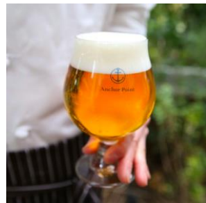
セッションIPA 680円 (税抜)