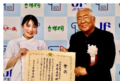
前回大会の授賞式の様子

:内閣総理大臣賞(総合第1位)...全部門の中から1名 衆議院議長賞(総合第2位)...全部門の中から1名 参議院議長賞(総合第3位)...全部門の中から1名 厚生労働大臣賞...西洋・中国料理部門から各1名(計2名) 文部科学大臣賞...日本料理部門から1名 農林水産大臣賞...日本料理部門から1名 観光庁長官賞...西洋料理部門から1名