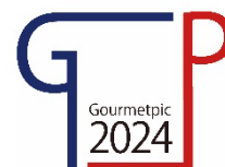
第39回大会ロゴマーク