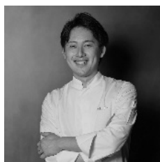
西洋料理 薬師神 陸