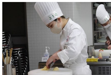
前回大会の調理作業の様子。選手はグルメピック全国大会オリジナルコックコートを着用します。