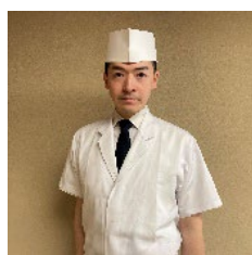
日本料理 丸山 典孝