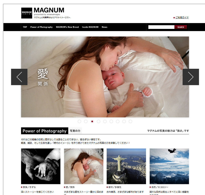
スペシャルサイト TOP 画面

アマナグループにおいてストックフォト販売事業を手がける株式会社アマナイメージズ(所在地:東京都品川区、代表取締役社長:小羽真司、以下アマナイメージズ)は、2012年11月15日(木)、広告制作に携わるクリエイター向けに、スペシャルサイト『MAGNUM presented by amanaimages』をオープンいたしました。(URL: http://amanaimages.com/magnum/ )