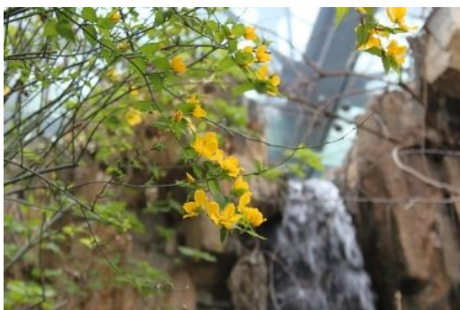
ふくしまの川と沿岸コーナーに咲くヤマブキ