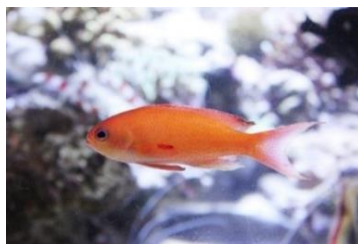
キンギョハナダイ