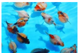
⑩ チョウチンパール