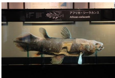
第2位 シーラカンス

アクアマリンふくしまでは、毎年夏に金魚まつりを開催し、2018年に新たに金魚館を新設するなど金魚の展示に力を入れてきました。今回チョウチンパールの1位を記念し、11月24日(日)～12月15日(日)の期間、エントランスホールにチョウチンパール水槽と大型看板を設置します。