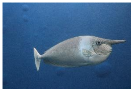
②ツマリテングハギ