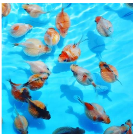
大賞 チョウチンパール

アクアマリンふくしま（福島県いわき市）は、11月24日（日）にアクアマリンふくしまで今年一番人気になった魚を決める「流行魚大賞2019」の結果を発表しました。大賞に輝いたのは夏の金魚まつりで展示された「チョウチンパール」でした。