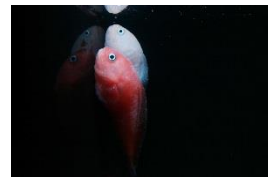
⑤タマコンニャクウオ