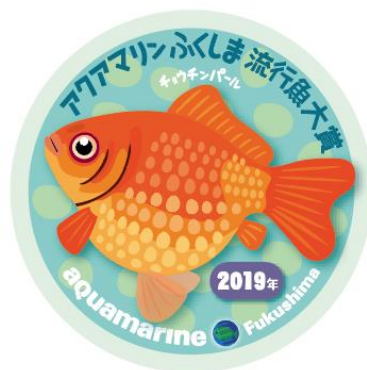
大賞記念ステッカー

今年初めて開催した流行魚大賞は約4,800人が参加しました。第1位に輝いたのは丸くて可愛いフォトジェニックな金魚である「チョウチンパール」（1,110票）でした。第2位はアクアマリンふくしまで開館当初より調査・研究している「シーラカンス」（768票）、第3位は日本ではアクアマリンふくしまでしか見ることができない深海魚「タマコンニャクウオ」（640票）でした。また、Twitterでの得票数が最も多かったのは天女のように美しい深海魚「ハゴロモコンニャクウオ」（503票中Twitterは159票）でした。11月24日の発表会ではアクアマリンふくしまの公式キャラクター「権兵衛」（ごんべえ）が登場し、イラストレーター・友永たろさんがデザインしたチョウチンパールステッカーを200名様に配布しました。