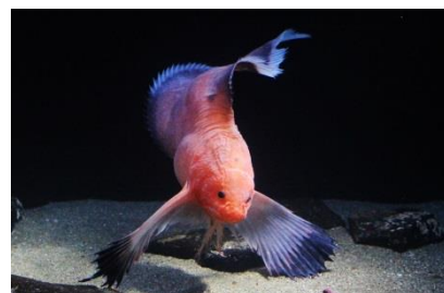
Twitter得票数第1位 ハゴロモコンニャクウオ

世界でアクアマリンふくしまでしか展示されていない貴重な魚です。2007年北海道の知床半島沖水深200～500mで発見された深海魚で、世界でまだ知床沖でしか見つかっていません。