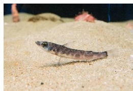
⑧マルアオメエソ (メヒカリ)