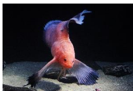
⑥ハゴロモコンニャクウオ