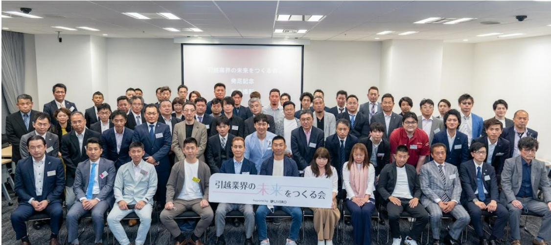
(「引越業界の未来をつくる会」発足式の様子)

— 課題解決をサービス開発と場の提供で支援、「働きたい」と言われる業界を目指す —