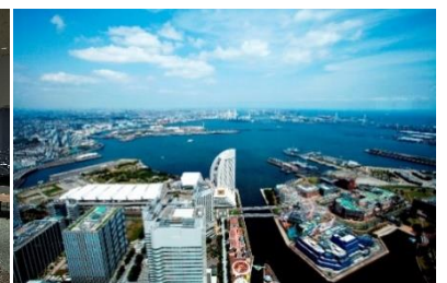
スカイカフェ / 横浜・空の図書室（昼） / 横浜・空の図書室（夜） ※撮影：Takuya Furusue / スカイガーデンからの眺望