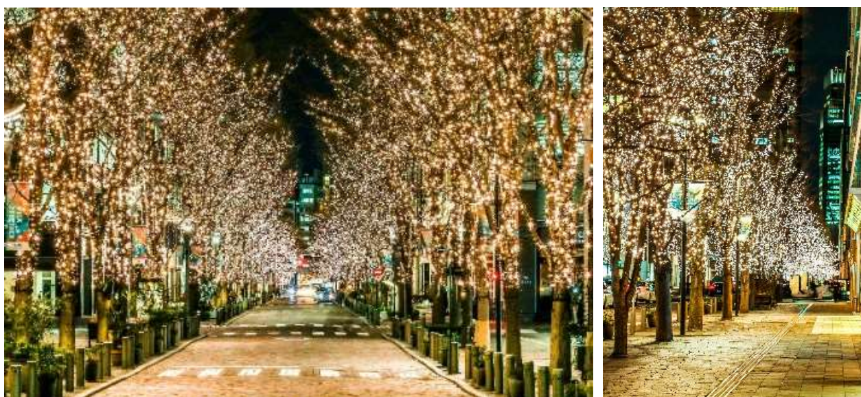
▲昨年開催時の様子

なお、新型コロナウイルス対策として、例年は 17 時～23 時（12 月は 24 時）までだったイルミネーションの点灯時間を、昨年同様に 2 時間早め、本年も 15 時から点灯します。お楽しみいただける時間を長くすることで、鑑賞いただく時間を分散させ、屋外でも密を避けながらゆったりと安心してお過ごしいただけます。