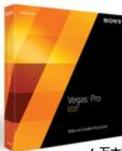
1万本限定 「Vegas Pro 13 Edit」 4,980円