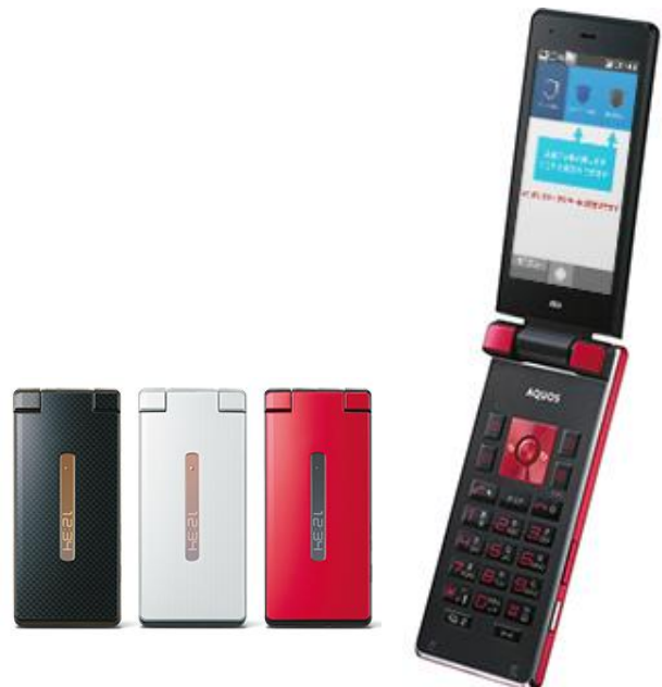
4G LTE ケータイ「AQUOS K」

※2 端末のボタン上部を指でなぞることにより画面上のカーソルを動かしてマウスのように操作できる機能です。