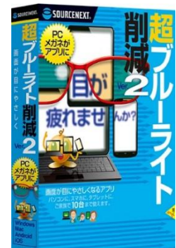
超ブルーライト削減(PC版)