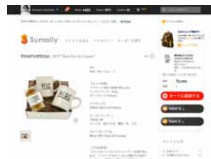
EC初出店となる「TODAY'S SPECIAL」のアイテム。