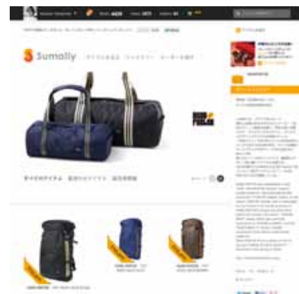
ヘッドポーター公式Sumallyページ。 販売中のアイテムにはプライスタグが表示されます。