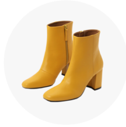
革など管理が難しいモノ