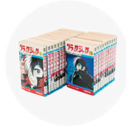
劣化させたくない本