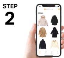
STEP 2 倉庫スタッフが1点ずつ撮影。 預けたモノはスマホで管理！