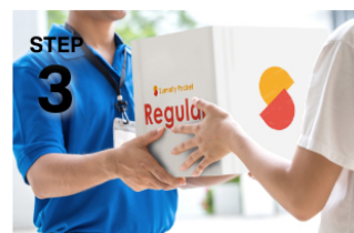
STEP 3 PC・スマホからいつでも簡単に 取り出し可能