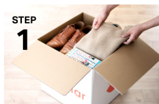
STEP 1 専用ボックスにアイテムを詰めて送るだけ

専用ボックスに預けたい荷物を詰めて送ると、荷物は全てスマホの中へ。預けたモノを確認するときも、取り出したいときも、自宅にいながらスマホ一つで可能する新時代の収納サービスです。