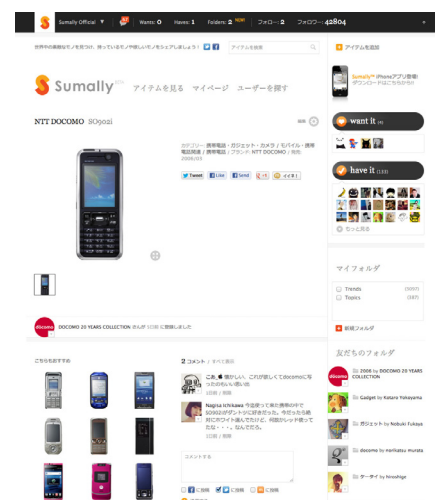
商品個別ページ。 人気機種には多くの「have」が。