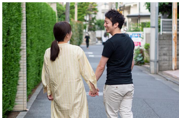
あなたは、いまの自分に「自信」がありますか？（単一回答）