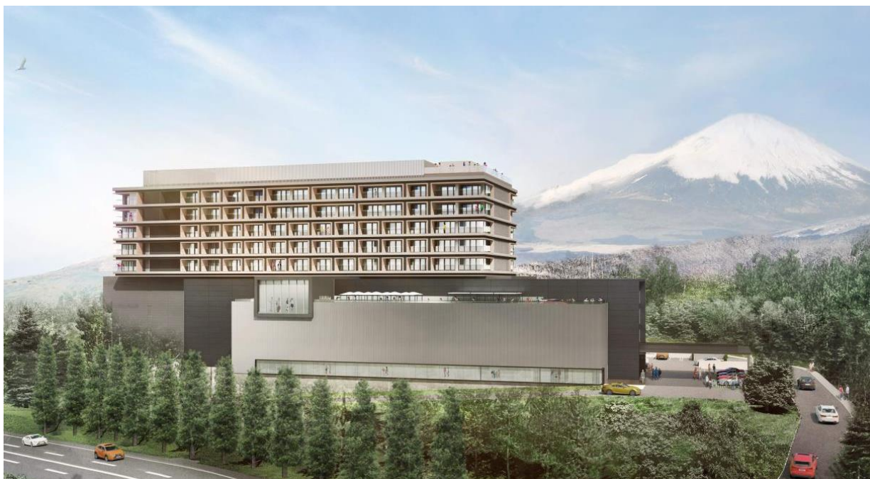
FUJI Speedway HOTEL外観（手前にFUJI MOTORSPORTS MUSEUM併設）