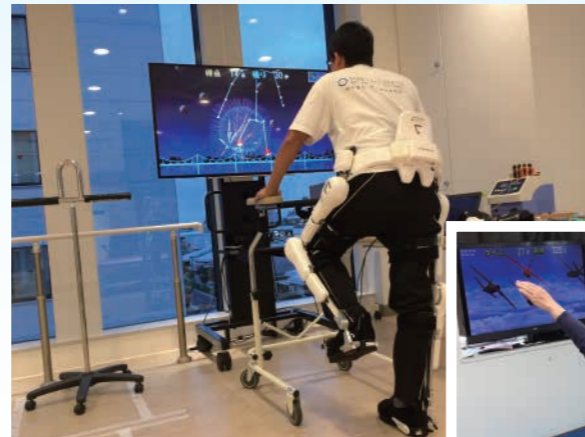
「ロボットスーツ HAL® (下肢タイプ)」を使用した TANO のトレーニングイメージ

プログラムの魅力は、自然と無理なく楽しみながら体を動かせることです。リハビリテーションに適した体の動きを取り入れており、年齢に関係なく誰でも簡単にご利用できます。