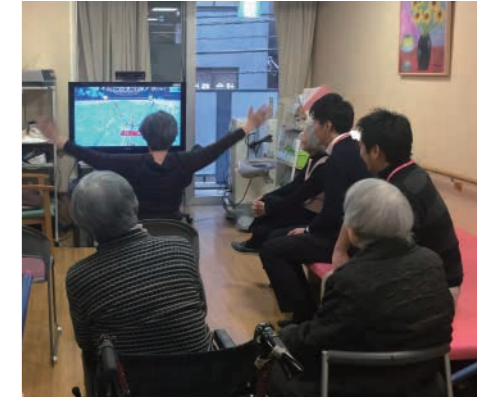
「厚生労働省 福祉用具・介護ロボットの開発と普及 2016」 実証協力：社会福祉法人シルヴァーウィング