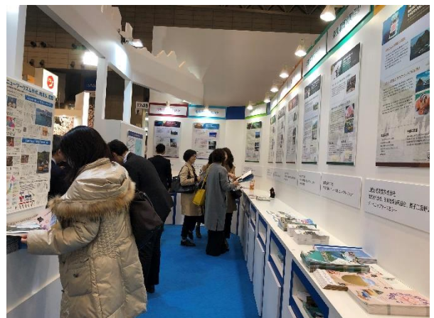
当日の 13 団体活動紹介出展ブース様子

地方創生 EXPO では、今回のニューツーリズム商品開発等支援事業において採択された全国 13 ヶ所で展開される中小企業・小規模事業者による、地域文化資源を活用した新たな商品・サービスの開発及びその販路開拓等の取組成果が出展ブースにて展示・紹介され、多くの方にご来場頂きました。