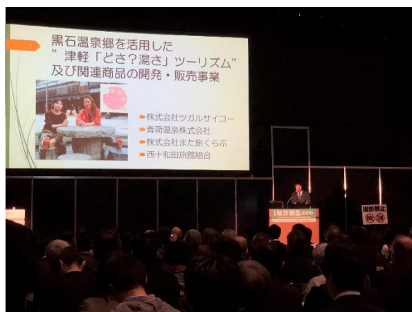
株式会社ツガルサイコー（青森県）プレゼンテーション様子

株式会社ツガルサイコーのプレゼンテーションでは、本事業の補助金を活用して「黒石温泉郷を活用した“津軽「どさ？湯さ」ツーリズム”及び関連商品の開発・販売事業」を推進、黒石温泉郷ならではの湯治体験と自然、歴史文化を活かした体験プログラムを滞在期間や嗜好に合わせて提案する仕組みを構築、湯巡り関連商品や伝統工芸品の名物土産品の試作開発を行ったことを発表しました。