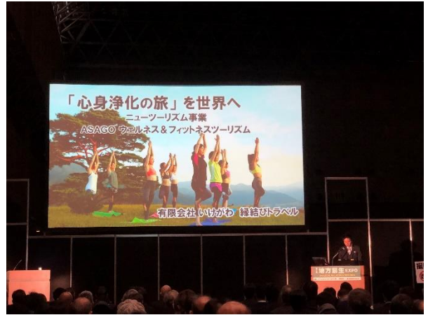
有限会社いけがわ(兵庫県)プレゼンテーション様子

「天空ヨガ」「お堂ヨガ」など今までにない心身浄化の体験プログラムの開発で非常に多くの方から注目されるプレゼンテーション内容となりました。