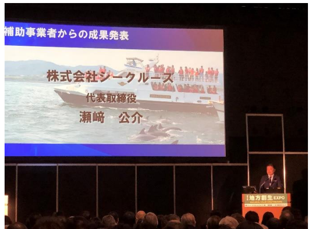
株式会社シークルーズ(熊本県)プレゼンテーション様子

株式会社シークルーズのプレゼンテーションでは、本事業の補助金を活用して「天草の歴史・文化・自然等を活用したインバウンド（FIT）向けニューツーリズム事業」を推進し、既存のクルーズ商品をインバウンド FIT 客向けに改良、また、日帰り客が多い現状からの脱却や集客拡大に向けたガイド付アクティビティ、ウェディングツーリズム等の新商品開発や英語ガイドの育成、ムスリム・ベジタリアン向けに食事メニューの改良を行ったことを発表しました。